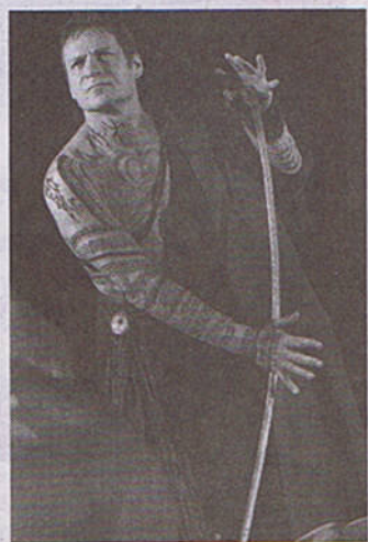
Prospero, v podání barytonisty Simona Keenlysidea, bude magickým vládcem tajemného ostrova v přímém přenosu Bouře z Metropolitní opery v New Yorku.

Opera The Tempest samozřejmě klade nároky na posluchače, a to nejen zhuštěným textem libreta, které svou zkratkovitostí připomíná dnešní písňové texty, ale především zvukovou stránkou, kterou bychom asi velice laicky přirovnali k současné filmové hudbě. Orchestr skladatel chvílemi stylizuje jako