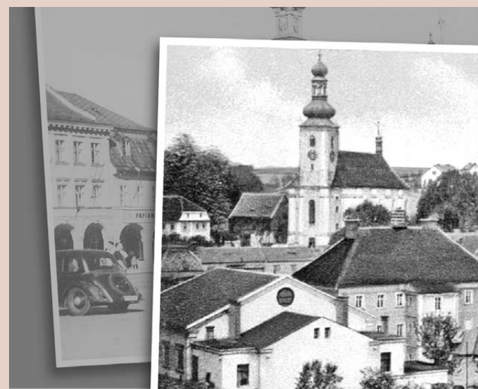
Vernisáž výstavy Pohledy do minulosti nejsevernějších Čech